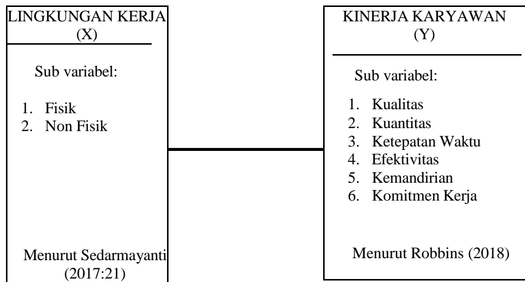
Gambar 2.1 Kerangka Pemikiran